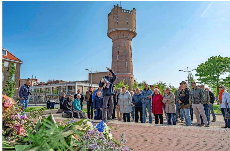
De eerste halte van de fietstocht: het monument voor de Marine en de Koopvaardij uit de Eerste Wereldoorlog dat bij een bombardement in de Tweede Wereldoorlog flink beschadigd raakte.

Den Helder raakte door de vele bombardementen zwaar beschadigd. Aan het begin van de oorlog telde de stad volgens Kikkert drie