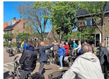
De Bankastraat waar bommen net als elders in de Indische Buurt voor schade aan huizen zorgden.